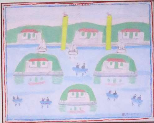
Eugen Buktenica, Otočići, 1990.