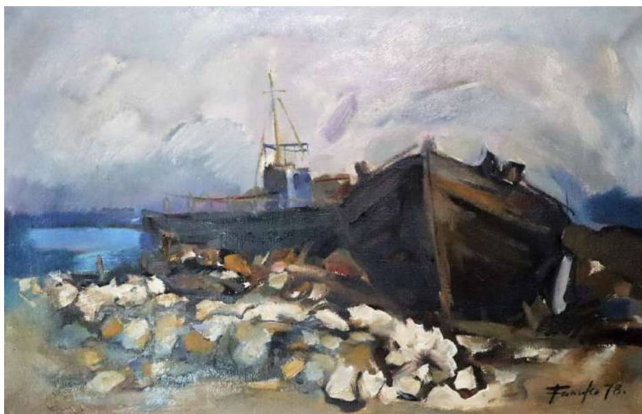
Ivan Fanuko, Brodovi, ulje na platnu, 1978.*

Aktivno se bavio i fotografijom, grafičkim dizajnom, ilustracijom i opremom knjiga, restauracijom umjetnina, restaurirao je oltar crkve Sv.Vida u Vrbovcu te freske na otočiću Košljunu.