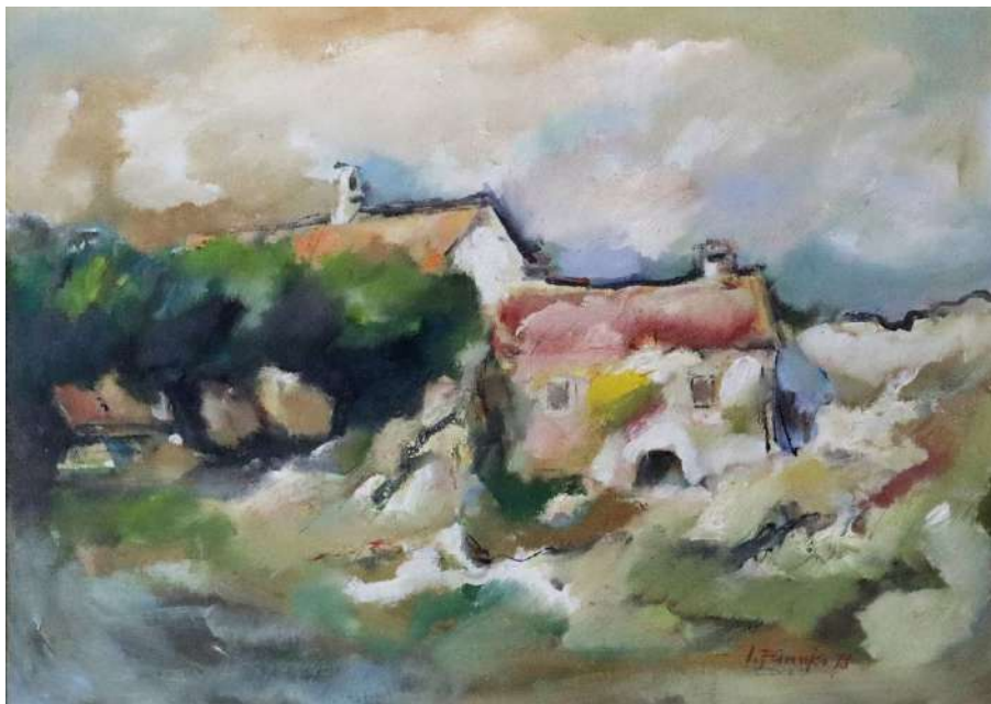
Ivan Fanuko, Dalmatinske kuće, ulje na platnu, 1978.*